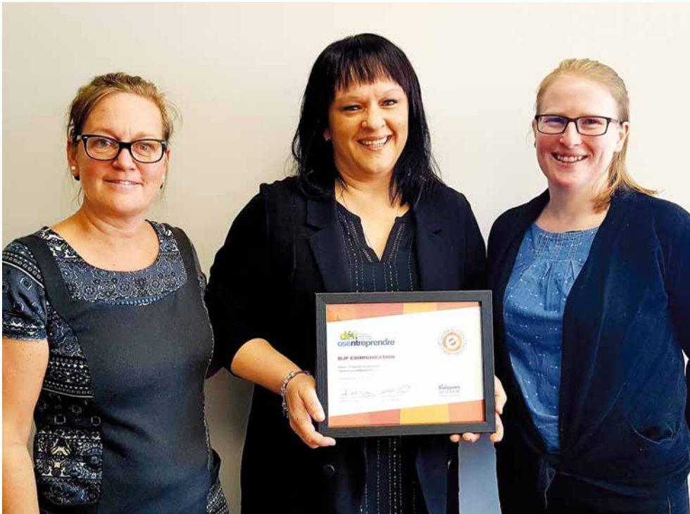
MJP communication a remporté dernièrement le prix coup de cœur, accompagné d'un montant de 200 $ dans la catégorie service aux entreprises, lors du Défi OSEntreprendre de la Capitale-Nationale. Cette nouvelle entreprise aide les PME de la région à être présentes sur les réseaux sociaux et dans leur campagne publicitaire de médias traditionnels.