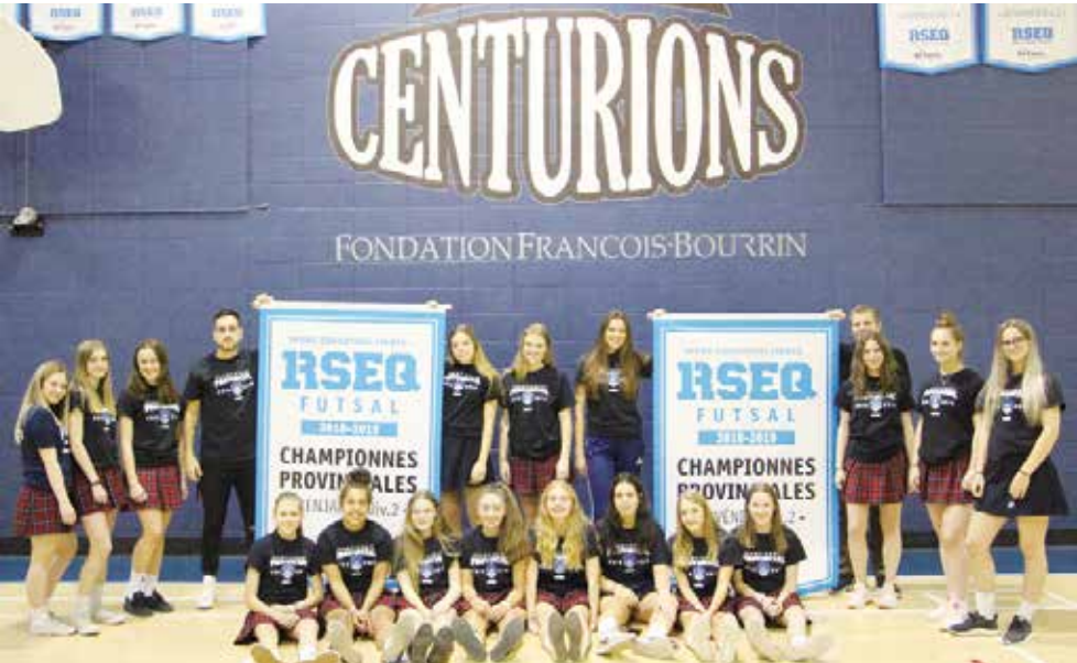
Les deux équipes féminines de futsal ont remporté les titres de championnes provinciales dans les catégories benjamin et juvénile sans connaître la défaite.

«Nous gagnons ces championnats contre des écoles pas mal plus grosses que la nôtre. Elles ont tous plus de 1000 étudiants et nous 282. À titre d'exemple, le collège Laval avait 90 joueuses à son camp en juvénile et nous seulement huit filles ! Je n'ai pas d'autre choix que d'être très fier de nos équipes qui travaillent dur, mais aussi du personnel qualifié qui s'occupe d'elles ».