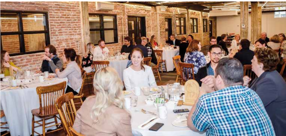
Vendredi le 10 mai a eu lieu le quatrième Dîner RésÔ avec Alliance Côte-de-Beaupré au Mont Champagnat. Plus de 30 entrepreneurs de la région étaient au rendez-vous. Ce dîner rencontre a permis aux entrepreneurs de mieux se connaître et de faire de nouvelles rencontres. Ce dîner RésÔ c'est bien plus qu'un échange de cartes d'affaires, il se veut un lieu de discussions en vue de tisser une relation professionnelle ou une amitié de confiance avec les participants.